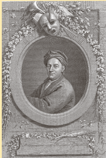
Heinrich Gottfried Koch

den Titel „Kurfürstlich Sächsischer Hofkomödiant“ und gründete eine eigene Schauspieltruppe, zu der auch seine Frau Christiane Henriette Koch gehörte. Sie spielten im Theater am Großen Blumenberg und in Quandts Hof. 1752 führte Koch in Leipzig mit großem Erfolg das erste deutsche Singspiel „Der Teufel ist los“ von Christian Felix Weiße auf und 1756 Lessings „Miss Sara Sampson“.