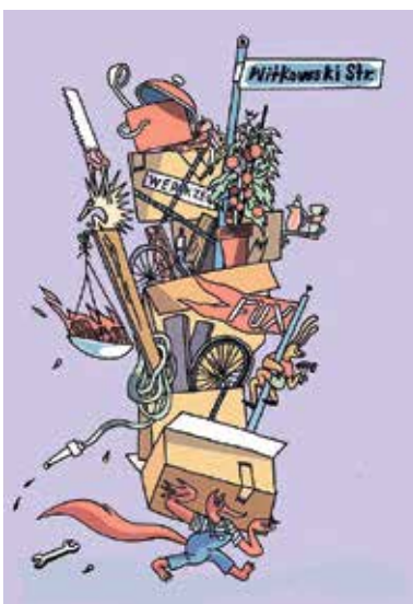
Grafik: Clara Girke

Der Bauspielplatz „Fuxbau“ ist in den letzten drei Jahren für viele Mockauer Kinder und deren Familien zum beliebten Treffpunkt geworden. Das Angebot ist durch den Stadtrat und den Jugendhilfeausschuss der Stadt Leipzig als eine wichtige Maßnahme der Jugendhilfeplanung im Stadtteil Mockau verankert. Seit 2021 wird der pädagogisch betreute Spielplatz „Fuxbau“ auf der Essener Straße 51 sehr gut angenommen. Durch die Beendigung des Pachtvertrages mit der LWB begann die Stadt Leipzig Mitte des letzten Jahres eine intensive Suche nach einem neuen Gelände, um das Angebot im Stadtteil zu sichern. Als geeignete Fläche erwies sich eine ungenutzte Wiese zwischen Schildberger Weg und Witkowskistraße in Mockau West, die sich in städtischem Eigentum befindet. Zurzeit ist der Bauspielplatz am neuen Ort im Aufbau und wird im März zunächst an Samstagen und von April bis Oktober, an vier