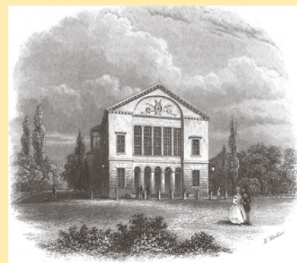
Komödienhaus auf der Rannischen Bastei um 1840.