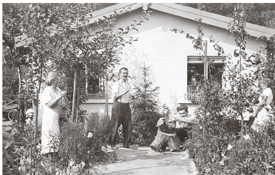
Gartenhaus im KGV „Waldessaum-Paunsdorf“.