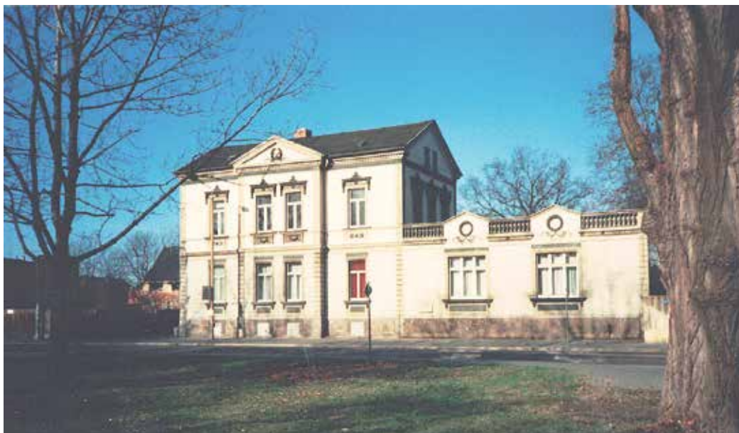
Die 1875 errichtete Villa Breiting mit dem 1902 angebauten eingeschossigen Gebäudetrakt.

1902 wurde ein eingeschossiger Gebäudetrakt im gleichen Stil an die Villa angebaut. Beide Gebäude stehen unter Denkmalschutz. Das Areal gehörte früher dem Gutsbesitzer Bautzmann aus Sellerhausen. Seit 1903 erinnert eine Bautzmannstraße in Sellerhausen an die Familie. Später wurde das Gebäude vom Gutsbesitzer Breiting erworben. Er ließ das ehemalige Bautzmann'sche Gut abreißen und errichtete darauf die Villa.