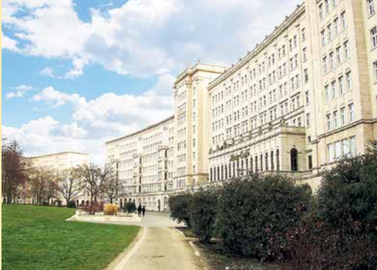
Ringbebauung am Roßplatz

Ratsherrn Caspar Bose, Häuser an der Südseite des Rossmarktes sowie Ausspannen und Gasthöfe, darunter der 1709 errichtete „Kurfürst“.