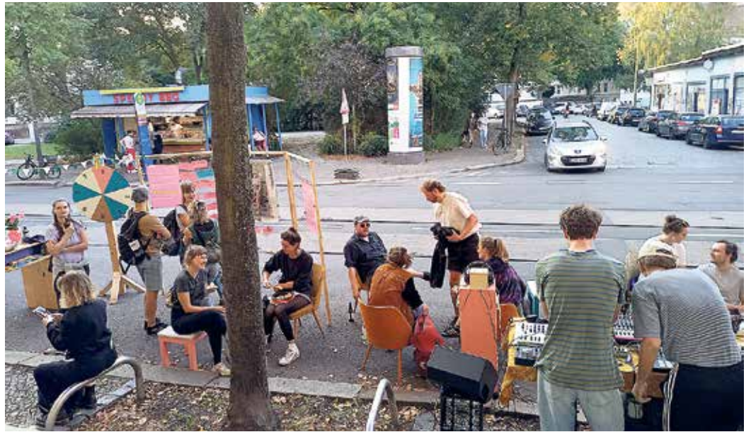
Freizeitoase contra Parkplatz. Die krudebude zum diesjährigen „Parking-Day“.

Derzeit arbeitet das Team der krudebude an einem neuen Projekt: „Abschied von Gesundheit?! (Ar-