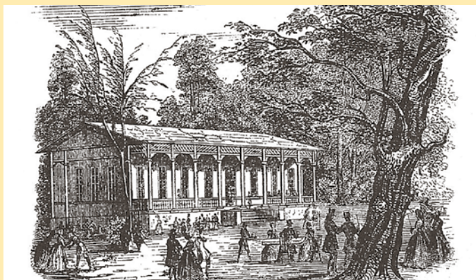
Schweizerhäuschen im Rosental um 1850. Abb.: Archiv der Autorin

tete „Schweizerhäuschen“ enthielt einen Saal, zwei Gesellschaftszimmer, eine Veranda, einen Musikpavillon und Freisitze. Bei gutem Wetter strömten die Leipziger mit Kind und Kegel zu „Kintschy“, um seine Windbeutel, Pfannkuchen und Liköre zu probieren.