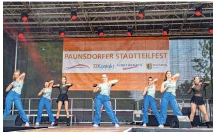
Ein voller Erfolg, das Stadtteilfest in Paunsdorf.

i Goldsternestraße 9 Tel.: 0341 | 253 22 87 info@javleipzig.de www.javleipzig.de