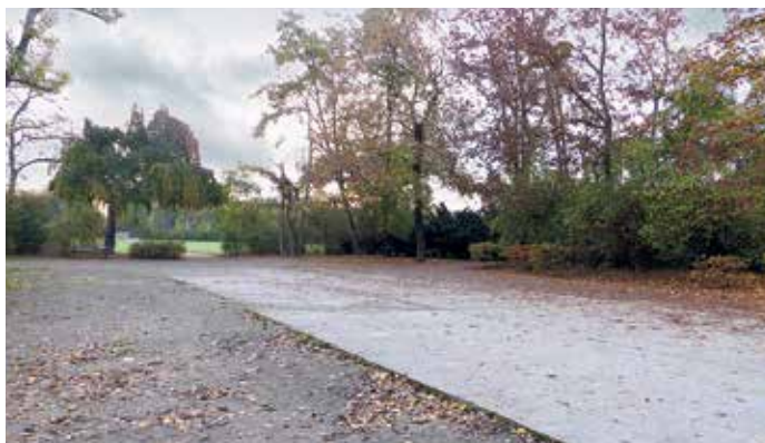
Kaum vorstellbar, an der Stelle der großen Betonfläche befand sich einst ein Planschbecken für Kinder. Nun soll der Platz neu gestaltet werden, auch mit Spielangeboten für Kinder.

Hintergrund: An dieser Stelle befand sich einst ein Planschbecken, welches 1928 beauftragt und mit roten Klinkern eingefasst wurde. Historische Fotos bezeugen die damalige Nutzung und zeigen Kinder beim Planschen; die Wassertiefe betrug etwa 50 cm. 1972 wurde das Planschbecken oberflächlich ersatzlos zurückgebaut und eine Betondecke an dieser Stelle angelegt. Laut der denkmalpflegerischen Zielstellung wird der Abbruch der jetzigen Befestigung empfohlen. Die Baumaßnahme ist die Vorbereitung für eine Neugestaltung der Platzfläche. Diese wird zeitlich später erfolgen.