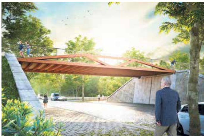
Visualisierung der Brücke.

Die ursprünglichen Widerlager der früheren Eisenbahnbrücke aus dem Jahr 1865 sollen zurückgebaut werden. Dafür entstehen Widerlager aus Stahlbeton in einer Stützwandkonstruktion. Vorgesehen ist künftig eine fünf Meter breite und etwa 17 Meter lange Brücke, die aus Stahlmodulen besteht. Diese müssen nicht aufwändig vor Ort geschweißt werden, sondern sie lassen sich durch schnell montierbare und bewusst sichtbare Bolzen aus Edelstahl leicht verbinden. Damit nimmt die neue Brückenkonstruktion auch den früheren