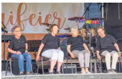
Hält fit: Gymnastik im Sitzen.