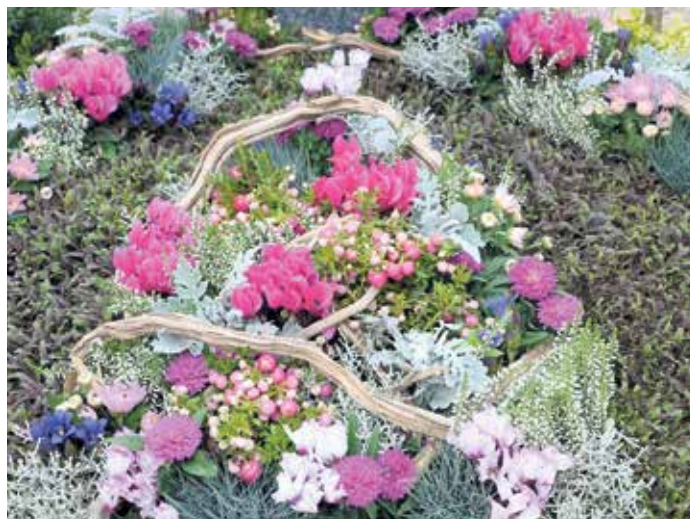
Herbstlich geschmücktes Grab.

Eine im Sommer schattenspendende Baumallee mit ausgewachsenen Linden führt direkt auf die Kapelle zu, in der ein Harmonium für Trauerfeiern oder Andachten bereitsteht. Die Bestattungsmöglichkeiten reichen vom preisgünstigsten Urnenreihengrab über Erdbestattungsgräber bis hin zur Baumbestattung, welche ab 2025 möglich sein wird.