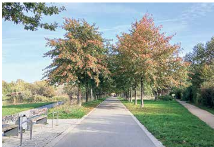
Ideal für einen Herbstspaziergang oder eine Joggingrunde – die Baumallee im Grünen Bogen.