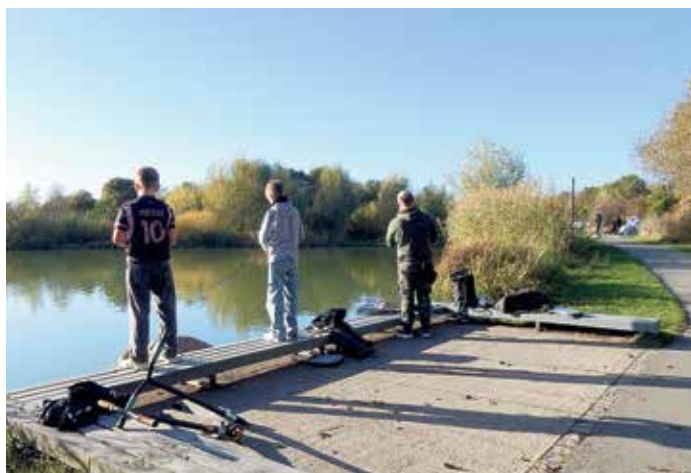
Die Teiche im Grünen Bogen Paunsdorf stehen unter Obhut des Leipziger Anglerverbandes, wird von den Mietgliedern gepflegt & gehegt.