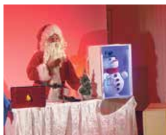
Hält bald Einzug: der Weihnachtsmann.

ressenten Adventsgestecke gestalten, melden Sie sich gern dazu an. Traditionell geht es dann am 1. Adventssonntag, am 1. Dezember von 15-17 Uhr weiter, in diesem Jahr freuen wir uns wieder einmal auf Gerd Christian, der uns schon vor einigen Jahren mit einem stimmungsvollen Weihnachtsprogramm und seinen beliebtesten Liedern vergangener Jahrzehnte verzaubert hat.