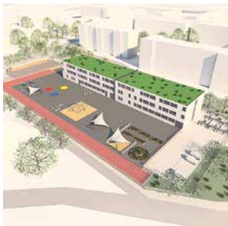
Phase 2: dreizügige Grundschule