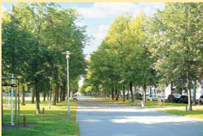
Wo einst die Alte Elster floss, erstreckt sich heute eine Lindenallee.