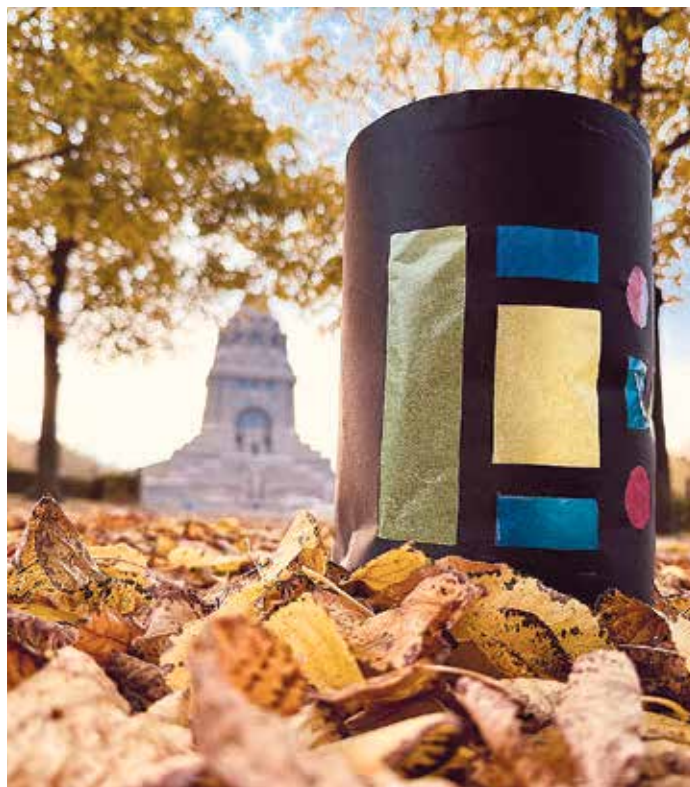
Papierlaterne im herbstlichen Denkmalpark.

i Termin: Sa. 2.11., 11 Uhr Völkerschlachtdenkmal, Straße des 18. Oktober Kosten: Eintritt ins Denkmal Anmeldung erbeten unter: besucherservice@voelkerschlachtdenkmal-leipzig.de