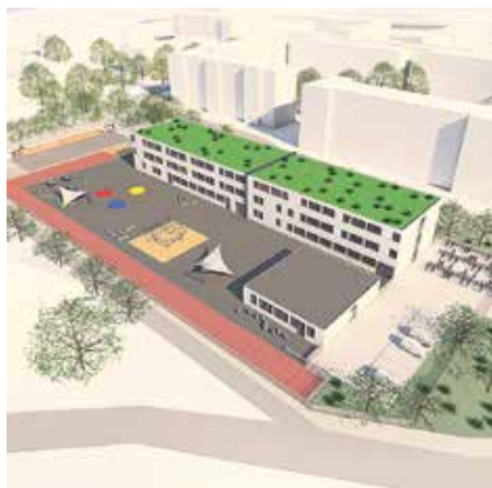
Phase 1: dreizügige Oberschule