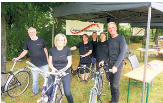
Gemeinsam radeln – das Team vom Jugend- und Altenhilfeverein.

Am Mittwoch, den 27. November, möchten wir bei Glühwein und Pfefferkuchen mit kreativen Inte-